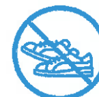
J'évite les efforts physiques