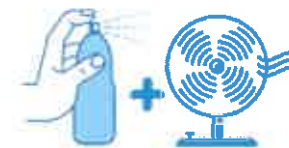
Je mouille mon corps et je me ventile