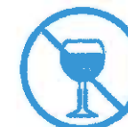
Je ne bois pas d'alcool