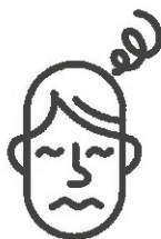
Vertiges / Nausées