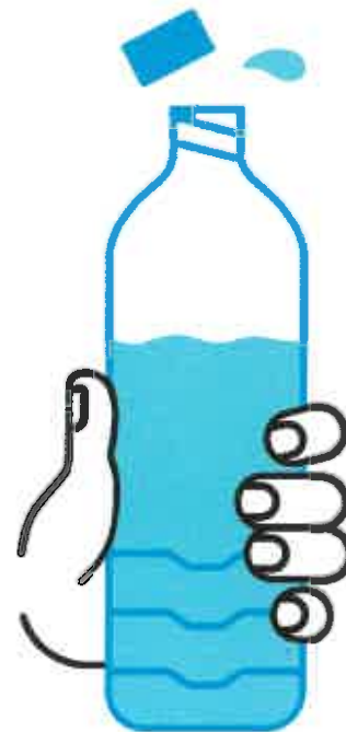
JE BOIS RÉGULIÈREMENT DE L'EAU