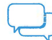
Je donne et je prends des nouvelles de mes proches