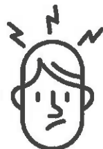
Maux de tête