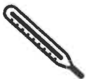
Fièvre > 38°C