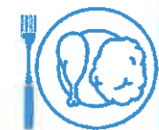
Je mange en quantité suffisante